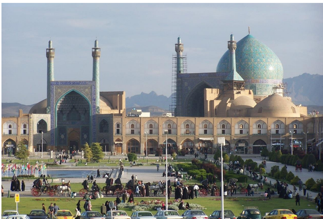
(تصویر ۴)، ورودی مسجد امام اصفهان، ( www.fardanews.com )

۵-مسجد علی اصفهان: موقعیت بنا، تعریف ورودی