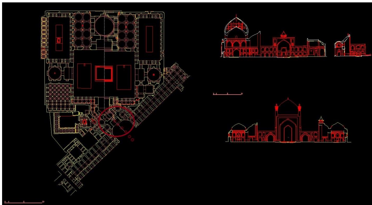
(تصویر ۳)، پلان و مقاطع مسجد امام اصفهان، ( www.fardanews.com )